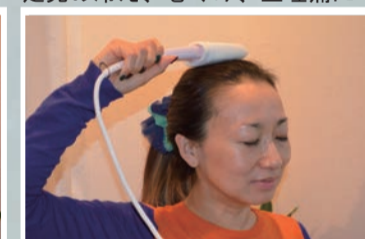
白髪、薄毛、ストレス解消に