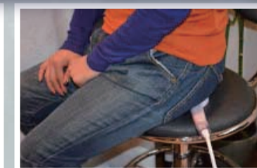
足先の冷え、むくみ、生理痛に