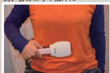
便秘、胃腸、代謝アップに